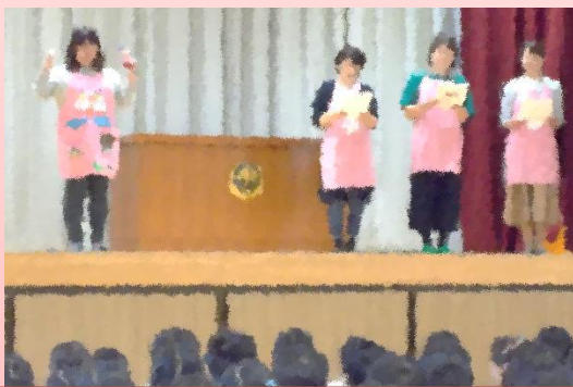
体育館での読み聞かせ

今月は、14日に1・2・3年生、21日に4・5・6年生に読み聞かせをしていただきました。