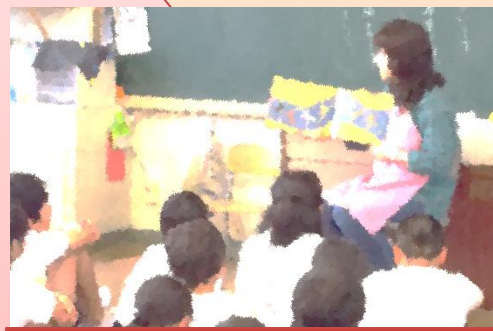
教室での読み聞かせ