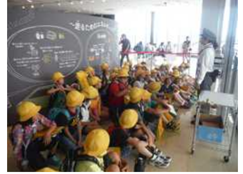
4年生社会科見学(6月19日)

6月は町探検や生物多様性子ども調査、社会科見学など、多くの地域の方と交流して子どもたちは大きく成長したようです。