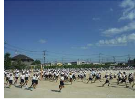
おはよう運動(6月16日)