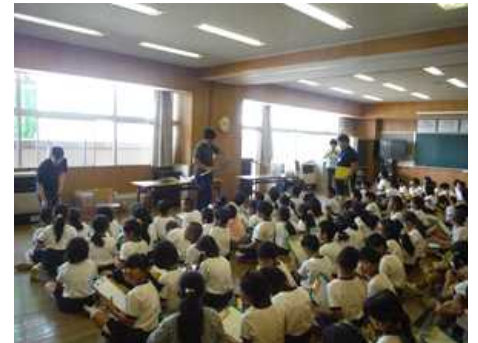
3年生ねぎ・くわいの植え付け(6月5日)