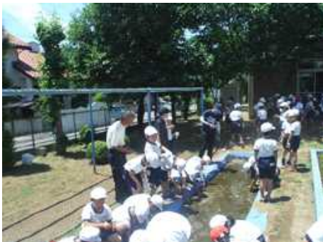
3年生くわいの植え付け(6月5日)