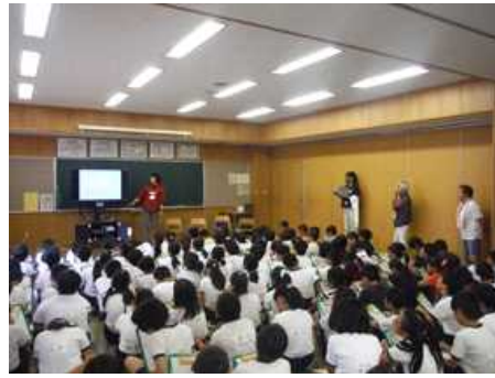
4年生生物多様性子ども調査(6月5日)