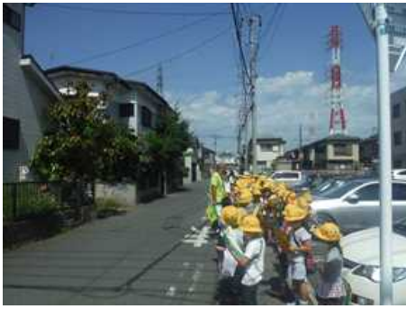
2年生の町探検(6月2日)宮本町