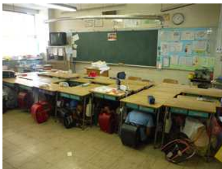
竜巻対応の避難訓練(6月16日)