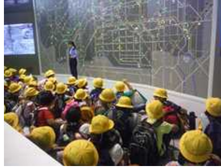
4年生社会科見学(6月19日)