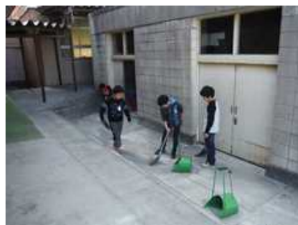
体育館横を掃除する6年生

6 年生が 6 日の準備登校の時、新学期に向けて、清掃や机の移動・入学式準備を一生懸命してくれました。