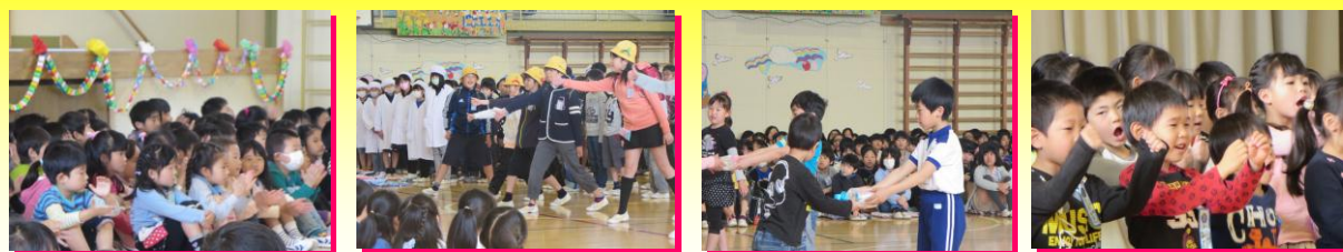
4月22日(水)新1年生128名を迎え、思いやりいっぱいの1年生を迎える会が行われました。