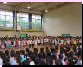
音楽朝会で心をつなげて「にじ」を合唱しました。