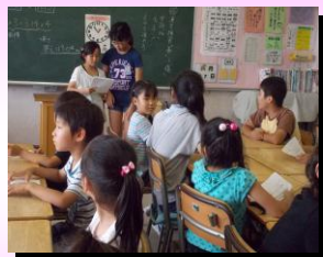
たてわり活動スタート!1~6年生までの仲間ができました。