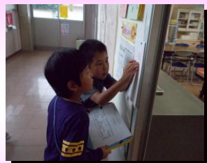
2年生のお兄さんお姉さんと学校探検しました。