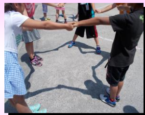
チームワークを生かして「かげ」の学習をしました。