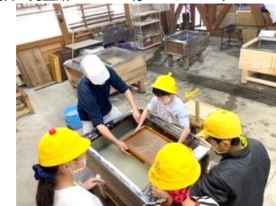
1月24日 4年社会科見学 東秩父村紙漉き体験、川越市街散策・菓子屋横丁で買い物をしました。