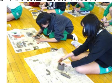
1月15日 6年陶芸教室 一人ひとりの個性があふれる作品に仕上がりました。焼き上がりが楽しみです。