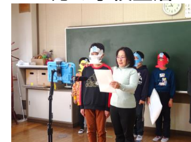
1月9日 第3学期始業式 さわきたレンジャー(保健委員会児童)が健康な生活について紹介してくれました。