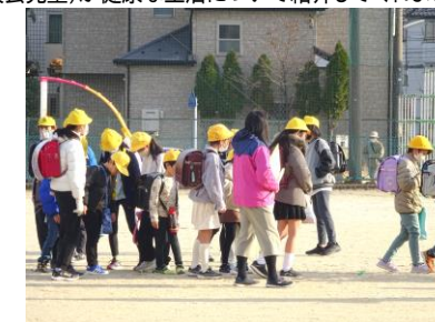
1月10日 一斉下校 通学班登校の約束を確認しました。これからも安全に登下校してください。