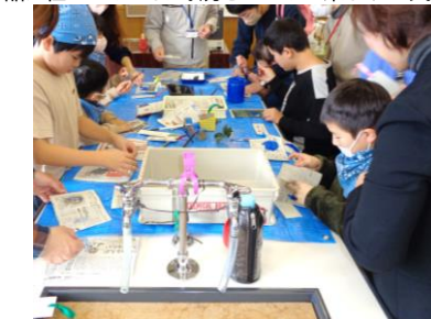
1月16日 たんぽぼ学級わくわくアート展 サンシティ越谷と児童館ヒマワリに行ってきました。