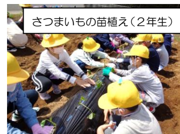
さつまいもの苗植え（2年生）