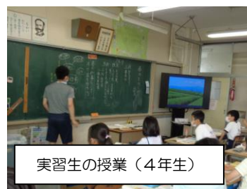
実習生の授業（4年生）