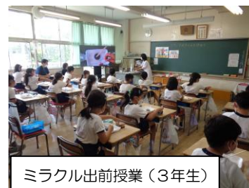
ミラクル出前授業（3年生）