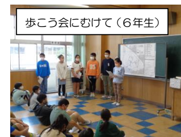
歩こう会にむけて（6年生）