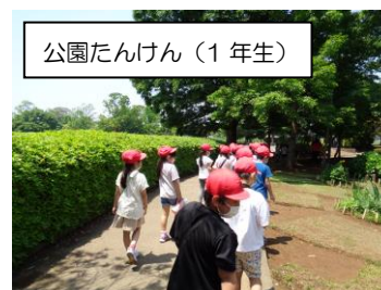
公園たんけん（1年生）