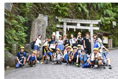
～親子クリーン活動～